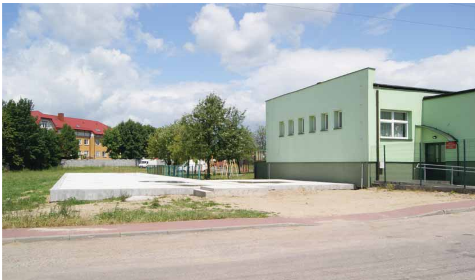
Rozbudowa Szkoły Podstawowej w Ojrzeniu