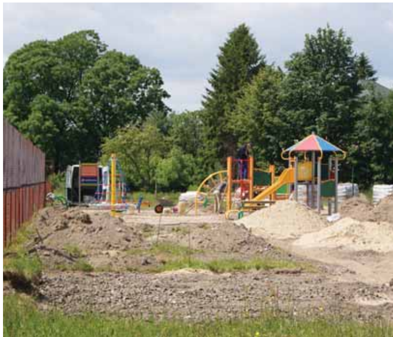
Plac zabaw przy Szkole Podstawowej w Ojrzeniu

W ramach Lokalnej Grupy Działania „Ciuchcia Krasieńskich” Gmina Ojrzeń otrzymała dofinansowanie na zakup wyposażenia kuchennego do świetlic wiejskich w: Nowej Wsi – 19.613,00 zł, Żochach – 24.411,00 zł, Młocku – 24.675,00zł, Kraszewie 24.979,00zł i Ojrzeniu 24 990,00 zł oraz zakup sprzętu do siłowni wiejskich w miejscowościach: Kraszewo na kwotę 6.159,00 zł i Ojrzeń na kwotę 12.495,00 zł.