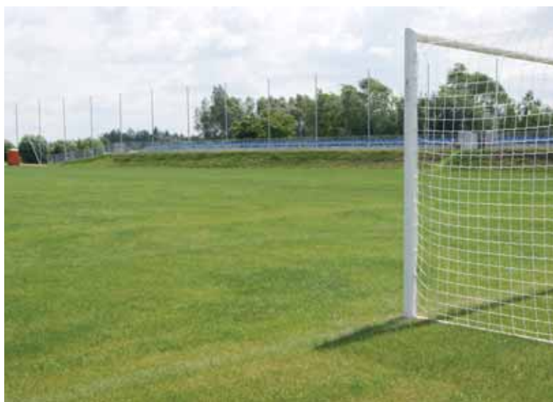
Boisko z nowymi trybunami