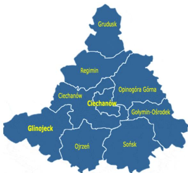
Rysunek 1 Mapa powiatu ciechanowskiego

Przez teren gminy przepływa rzeka Łydynia, wpadająca do rzeki Wkry w sąsiedniej gminie. Czystość środowiska wodnego gminny powoduje, że na jej ternie licznie występują także bobry i wydry. Ukształtowanie powierzchni gminy powstało w wyniku oddziaływania lodowca i późniejszych zmian erozyjnych – teren jest równinny z obniżeniami w dolinie rzeki Łydyni.