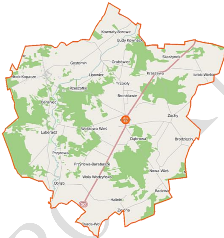
Rysunek 2 Mapa Gminy Ojrzeń

Gmina leży w zasięgu oddziaływania miasta Ciechanowa. Związane jest to z funkcją ośrodka administracyjnego i gospodarczego, jaką pełni to miasto na obszarze powiatu. Odległość ośrodka gminnego od wspomnianego wyżej miasta to ok. 14 km.